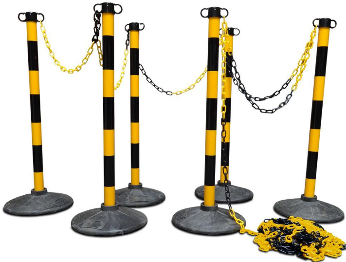
Figuur 2: paaltjes en kettingen om een looproute te begrenzen.

Zorg als organisatie voor drinkflesjes en hang die pas na inname van de vogels aan de kooien. Dan zijn die zeker “schoon” als de voerploeg ze later in handen neemt. Ook parkieten worden tegenwoordig, in het kader van dierenwelzijn, bij het inbrengen al voorzien van water. Laat dus niet tot na de keuring vogels “op een droogje” zitten. Denk na over de looproutes voor deelnemers en vrijwilligers en geef die duidelijk aan. Zet eventueel paaltjes met linten of kettingen neer om te voorkomen dat er wordt afgesneden.