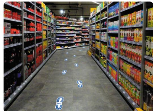
Figuur 1: Looproute tussen de rekken in een winkel en stickers om deze aan te geven. Dit is maar één voorbeeld van wat er op Internet verkrijgbaar is.