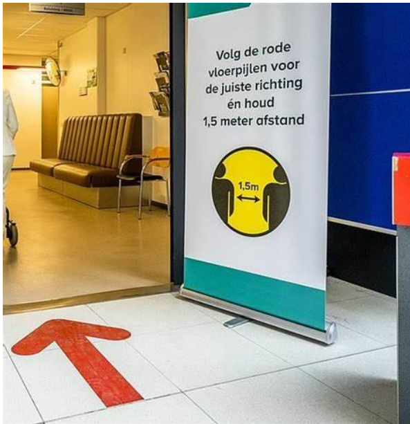
Figuur 5: Zo zou de ingang van uw showgedeelte er uit kunnen zien. Indien mogelijk wel met een vrijwilliger er naast die zorgt dat er niet te veel belangstellenden tegelijkertijd binnen zijn.